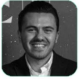
GEN GROUPS Y.K Alper KARAVAR